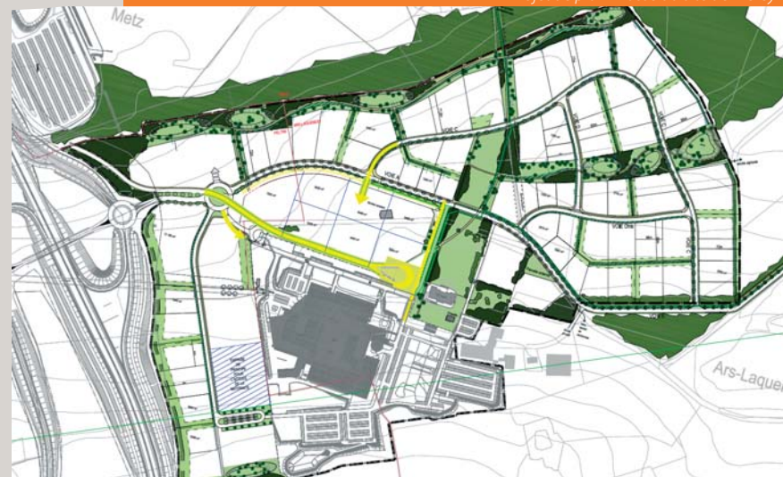
Projet de plan masse du site de Mercy