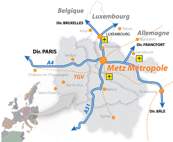
Metz Métropole, idéalement située aux limites des trois frontières.