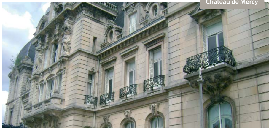
Château de Mercy