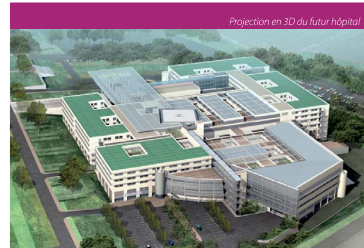
Projection en 3D du futur hôpital