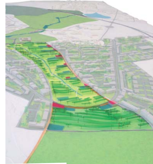
Le grand parc central